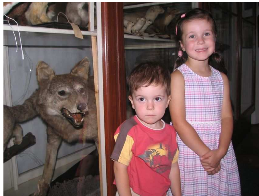
Kdopak by se velkomeziříčského vlka bál?