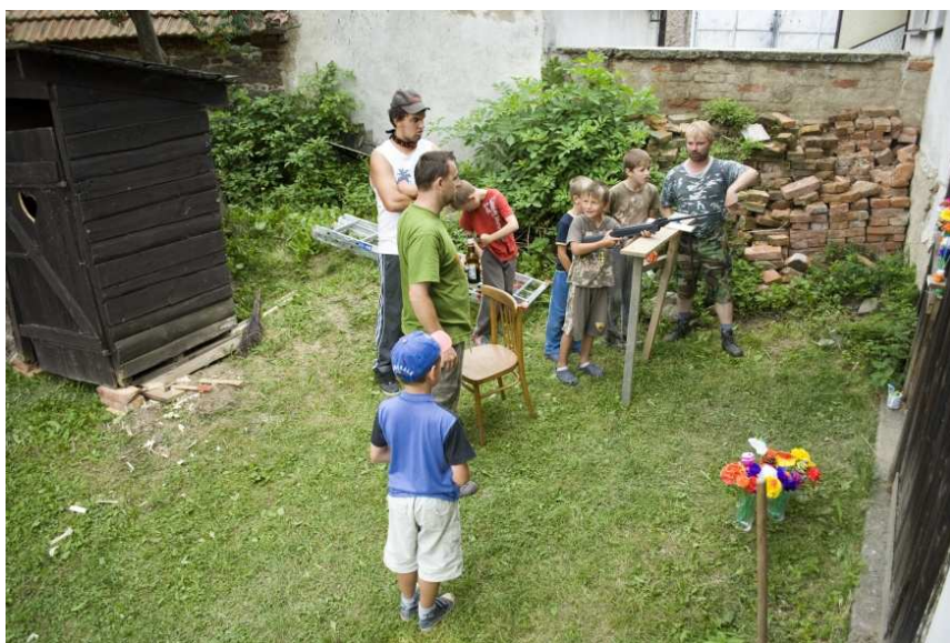
Strejdo, a koho mám zastřelit? A když se trefím, dostanu taky růžičku?