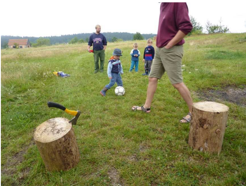
Tzv. sekyrkový fotbálek. Je to velmi oblíbený vysoce adrenalinový sport pro všechny generace, jen při něm můžete lehce přijít o hlavu.