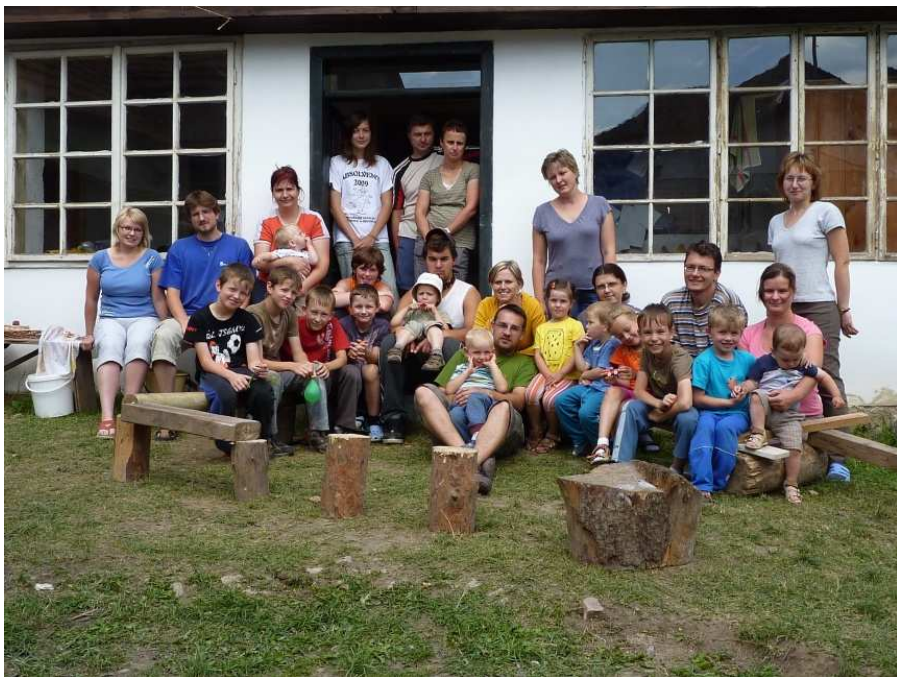
Závěrečný grupáč roku 2009.