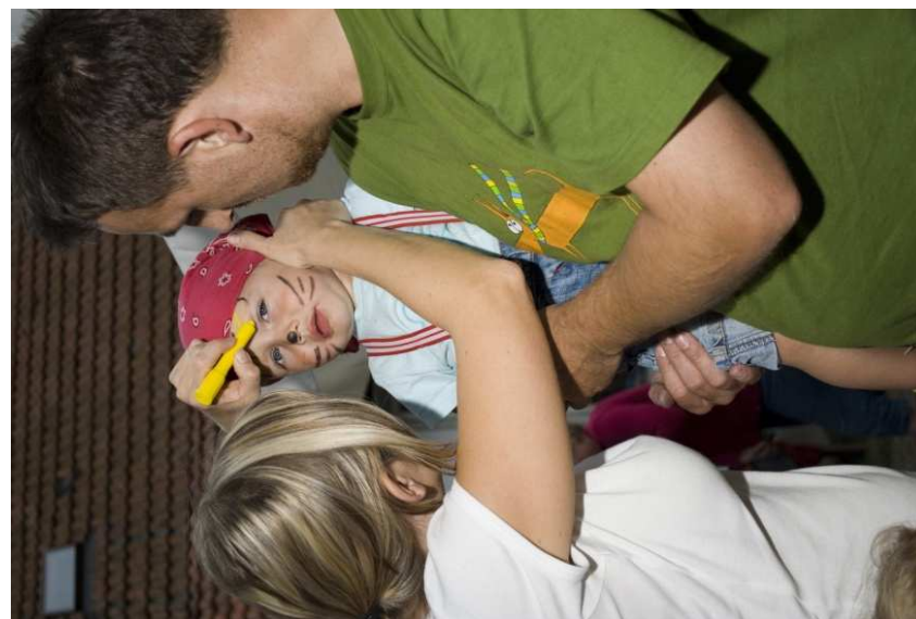
Nelíbí se Vám Vaše dítě? Nevadí! Přemalujte ho na hezčí, nebo si z něj udělejte roztomilé zvířátko.