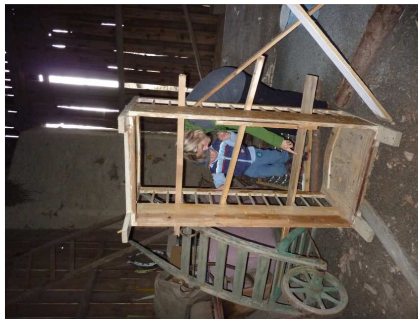
A když budeš zlobit, tak tě sem zavřeme a budeme tě strašně mučit.